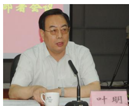
建筑工业化领域专家